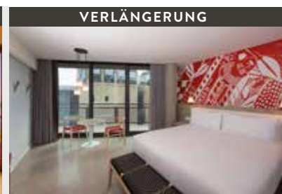
Kapstadt | Radisson RED Cape Town (4*) Studio Suite | Stylisches Hotel an der Waterfront