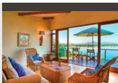
Malawisee | Pumulani Lodge (4*) Villa | Luxuriöse Strand-Lodge am Ufer des Malawisees