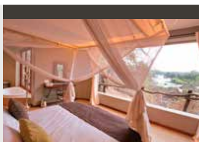
Majete | Mkulumadzi Lodge (4*) Chalet | Entlegene Luxus-Lodge mit First-Class-Einrichtung