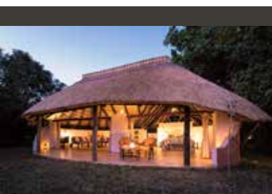
South Luangwa | Nkwali Camp (3*) Chalet | Geräumige Chalets mit wunderbarem Blick auf den Flusslauf

Verlängern Sie noch ein paar Tage in Ihrer schönen Lodge am Malawisee. Leistun-