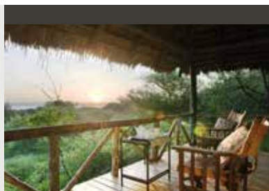
Tarangire-Nationalpark | Lake Burunge Tented Camp (3.5*) Classic Room | Afrikanisches Flair am Lake Burunge