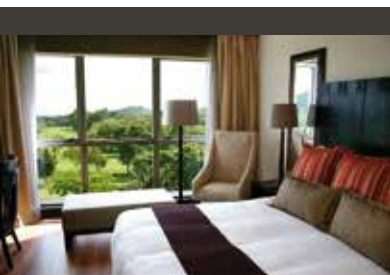
Arusha | Mount Meru Hotel (4*) Classic Room | Zentrales Hotel mit Blick auf den Kilimandscharo