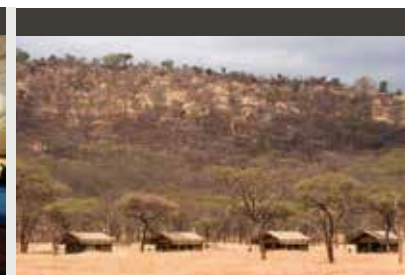
Serengeti | Serengeti Kati Kati Tented Camp (3.5*) Tent | Blick auf die Steppe