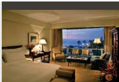
Lima | Belmond Miraflores Park (5*) Ocean View Junior Suite | An der Steilküste im Stadtteil Miraflores