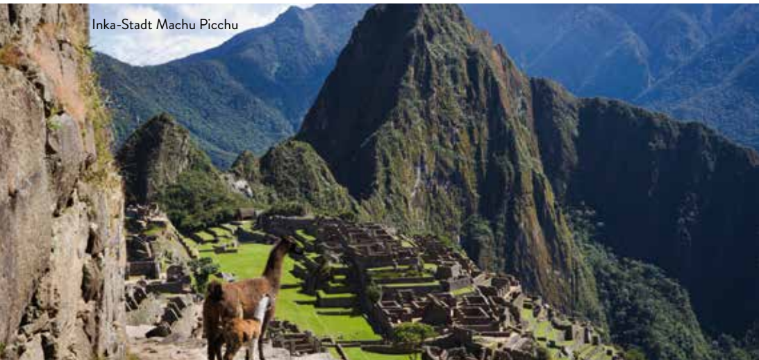
Inka-Stadt Machu Picchu