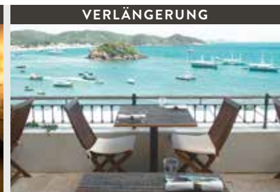
Búzios | Casas Brancas Boutique Hotel & Spa (4*) Deluxe Room | Schöner Blick aufs Meer - auch bei Sonnenuntergang