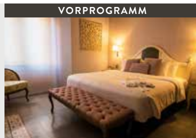
Panama City | La Concordia Boutique Hotel (5*) Santa Ana Room | Geschmackvoll und elegant