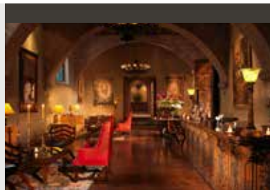
Cusco | Belmond Hotel Monasterio (5*) Deluxe Room | Wohnen in einem ehemaligen Kloster im Herzen der Stadt