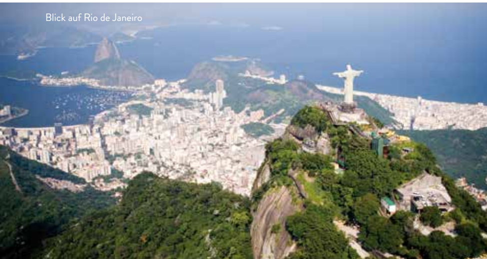
Blick auf Rio de Janeiro