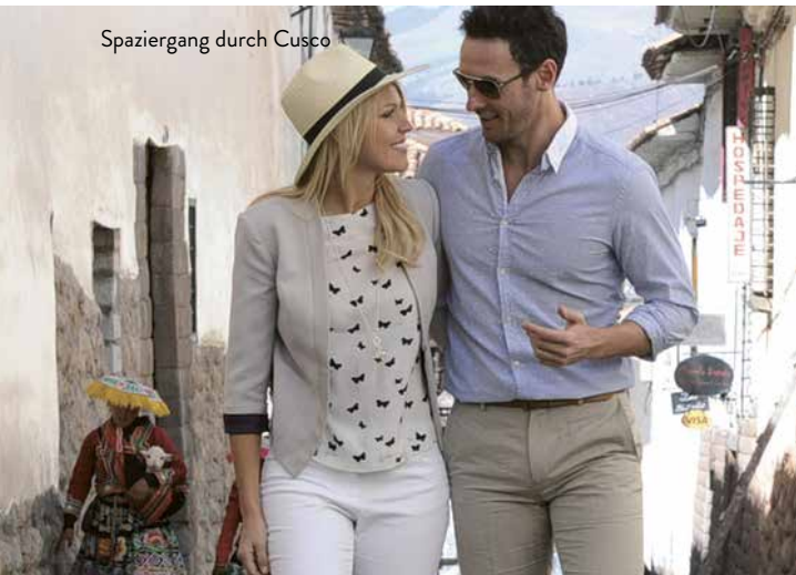
Spaziergang durch Cusco