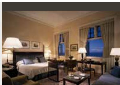
Rio de Janeiro | Belmond Copacabana Palace (5*) Deluxe Beach View Room | Ein Wahrzeichen Rios in feinstem Art déco Design