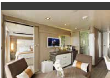
Auf See | Le Soléal (Schiff) Prestige Suite | Große Suite mit privatem Balkon