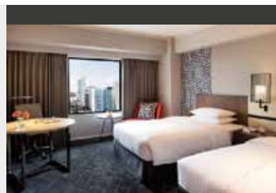
Osaka | Courtyard Marriott Shin-Osaka Station (4*) Classic Room | Moderne, große Zimmer