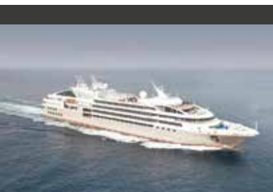
Auf See | Le Soléal (Schiff) Luxus, Intimität und Wohlbefinden bei nur 132 Kabinen

Besuchen Sie auch Kyoto und Nara, die „Wiege der japanischen Kultur“. In beiden Städten stehen viele historische Bauten unter UNESCO-Schutz. Leistungen: Transfers und Ausflüge mit öffentlichen Verkehrsmitteln, Qualifizierte WINDROSE-Reiseleitung (ab 6 Teilnehmern), 3 Übernachtungen im Kyoto Century Hotel (4* | Standard Room), Frühstück.