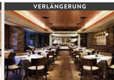
Kyoto | Century Hotel (4*) Classic Room | In der Nähe des extravaganen Hauptbahnhofs