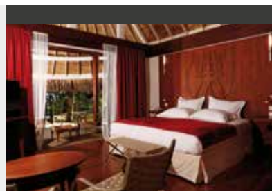
Bora Bora | Sofitel Bora Bora Marara Beach Resort (4*) Beach Bungalow | Authentische polynesisische Atmosphäre