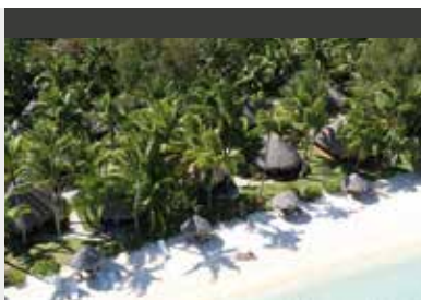
Bora Bora | Sofitel Bora Bora Marara Beach Resort (4*) Beach Bungalow | Stylistische Bungalows und wenige Meter zum Strand