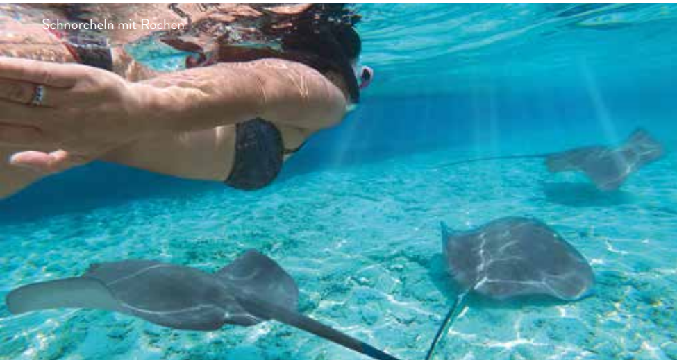
Schnorcheln mit Rochen