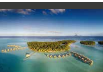
Taha'a | Le Taha'a Island Resort & Spa (5*) Taha'a Overwater Suite | Einmalige Lage auf eigener Insel

6. TAG RAIATEA | Auf einer Tages-tour erleben Sie die Höhepunkte Raiateas zu Lande und auf dem Wasser. Auf der Vanilleinsel lernen Sie natürlich eine Vanilleplantage kennen, beim Besuch bekommen Sie einen Einblick in den kompletten Produktionsprozess bis hin zur fertigen Schote. Außerdem geht es zur Verkostung in eine Rum-Destillerie und zu einer Perlenfarm: Französisch-Polynesien ist für seine schwarzen Perlen weltweit berühmt. Vom Boot aus erleben Sie, wie Haie und Rochen gefüttert wer-