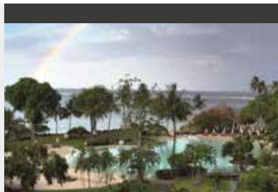
Papeete | Tahiti la Ora Beach Resort managed by Sofitel (4*) Luxury Garden Room | Gepflegte Anlage mit großem Meersandpool