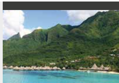
Moorea | Sofitel Moorea la Ora Beach Resort (4*) Luxury Bungalow Garden View | Herrliche Lagunenlage mit Korallenbänken