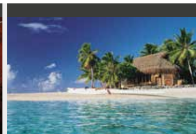
Tikehau | Tikehau Pearl Beach Resort (4*) Beach Bungalow | Kleines, rustikales Resort inmitten der Natur