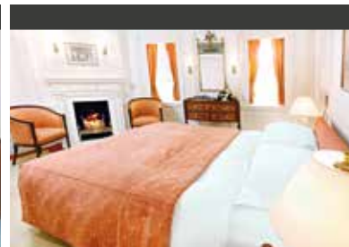
Auf See | SEA CLOUD (Schiff) Kabine Kategorie B, elegante Ausstattung und Doppelbett