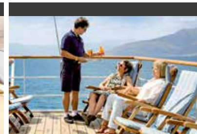
Auf See | SEA CLOUD (Schiff) Oberdeck, viel Platz auf dem Teakholz-Deck